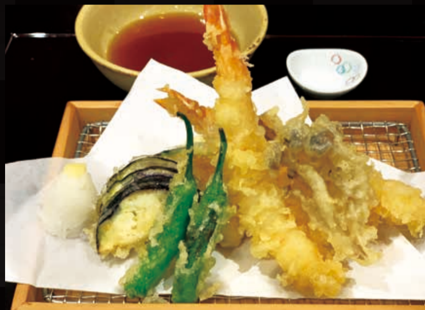
86. 天麩羅の盛り合わせ