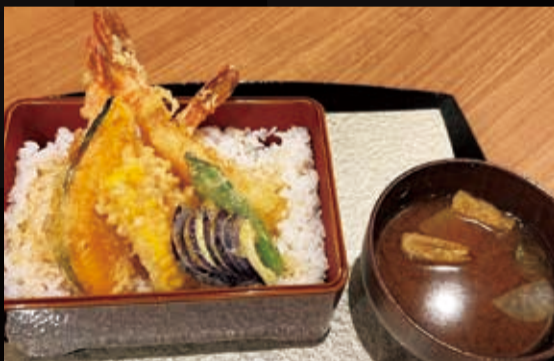
25. 海老天重 (3尾)