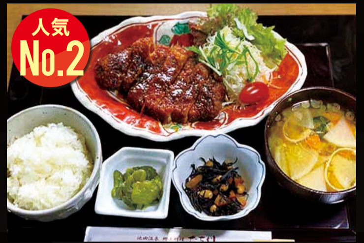
42. 大垣養老高校コラボ味噌カツ定食