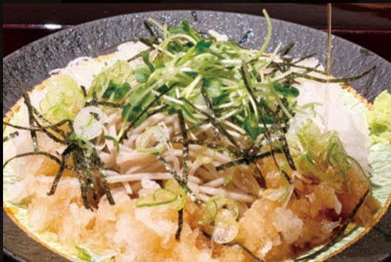
6. 大根おろし入り池田温泉そば