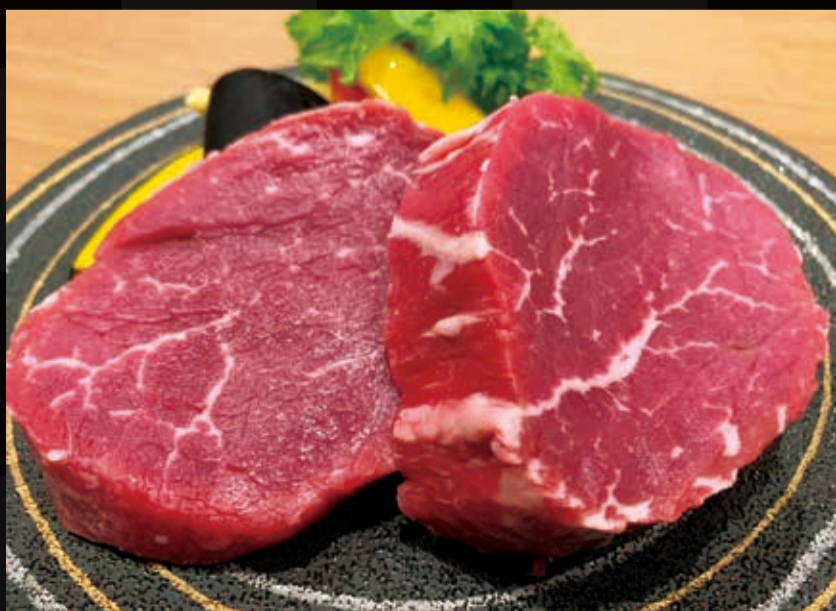
91. 和牛ヒレスステーキ 200 g