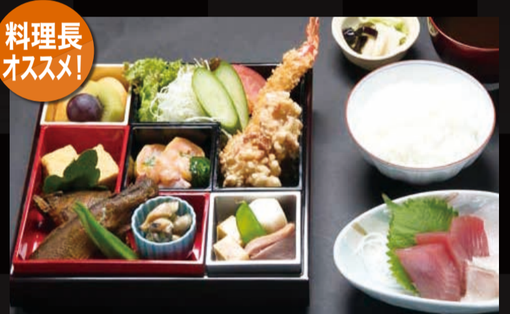
44. 松花堂御膳 (しょうかどうごぜん)