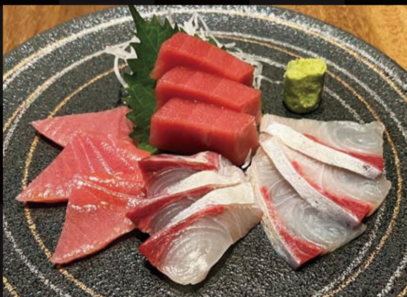
87. 旬のお刺身盛合わせ