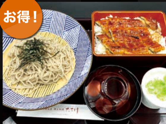
55. 国産特上うなぎ重とざる蕎麦セット