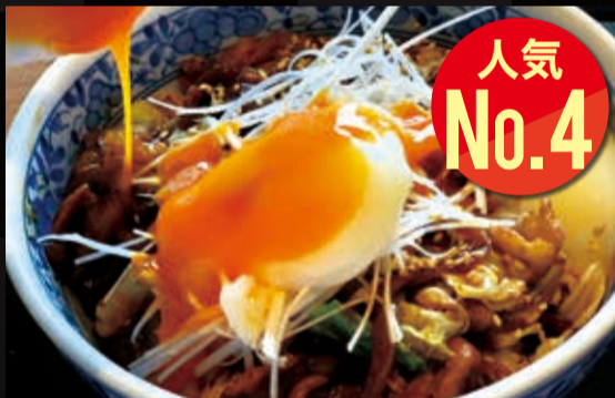
23. 大垣養老高校コラボ味噌豚丼