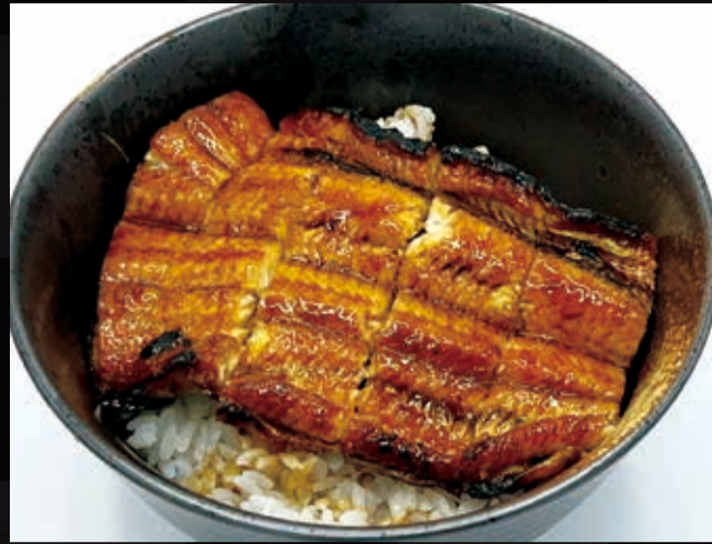
52. 国産特上うなぎ (半身)