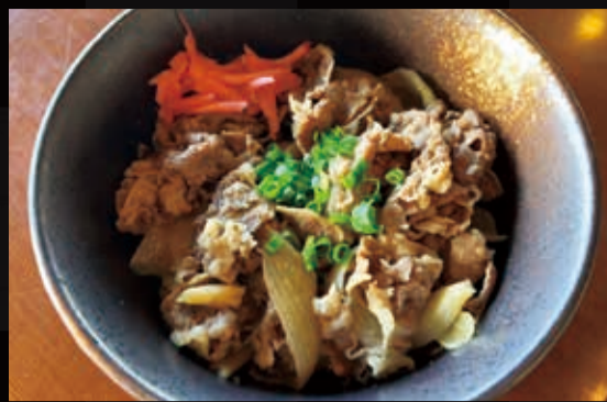
19. 特選牛丼 (温泉卵付き)