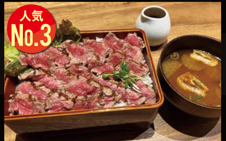
47. 和牛ヒレステーキ重定食 200g