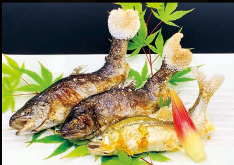
109. 川魚の3種盛(鮎・アマゴ・イワナ)