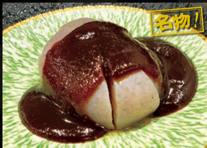
63. 春日村の極上手作り玉こんにゃく