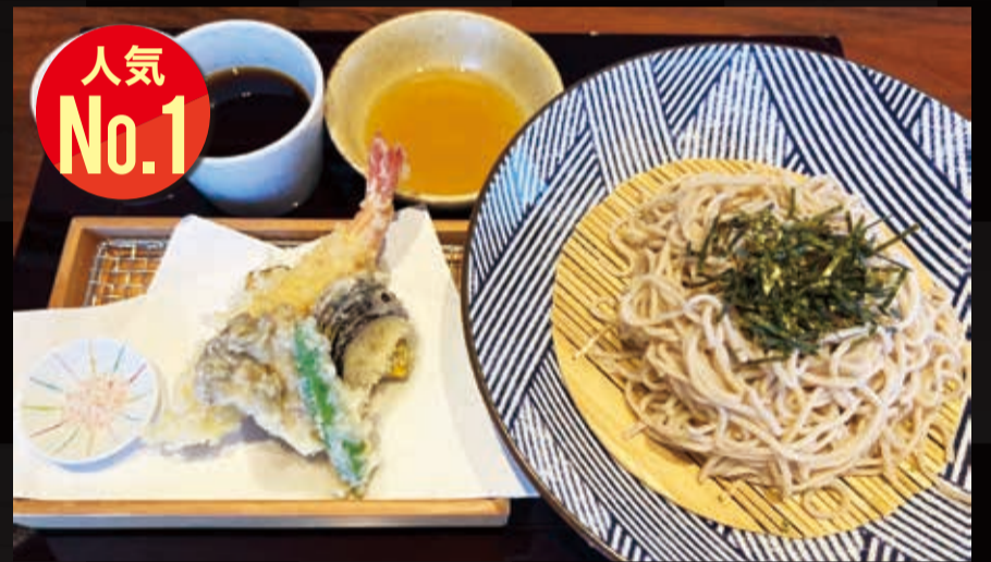
8. 天麩羅盛合せと池田温泉そば