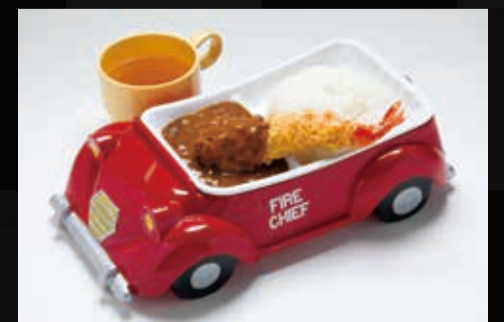
49. 自動車 カレーセット