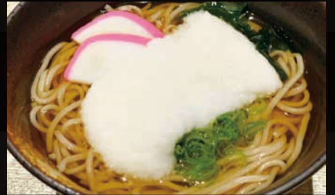
5. 山かけそば 温