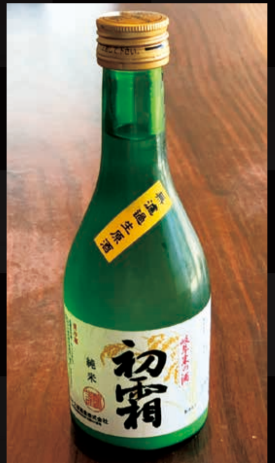
166. 初霜 純米生原酒