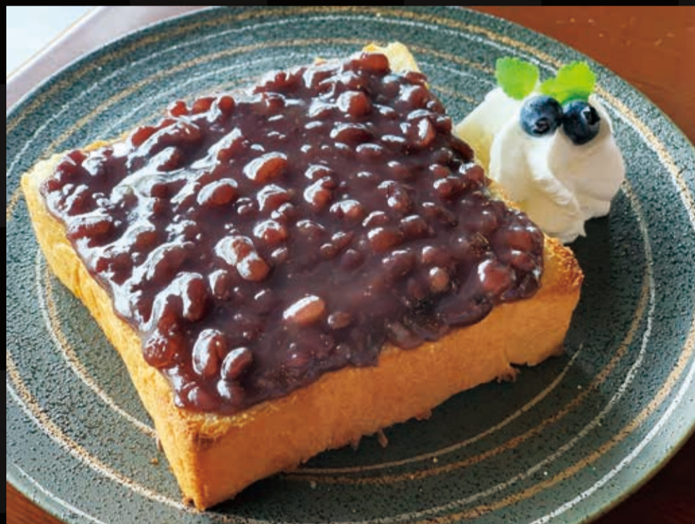
135. 小倉トースト(ソフトクリーム付)