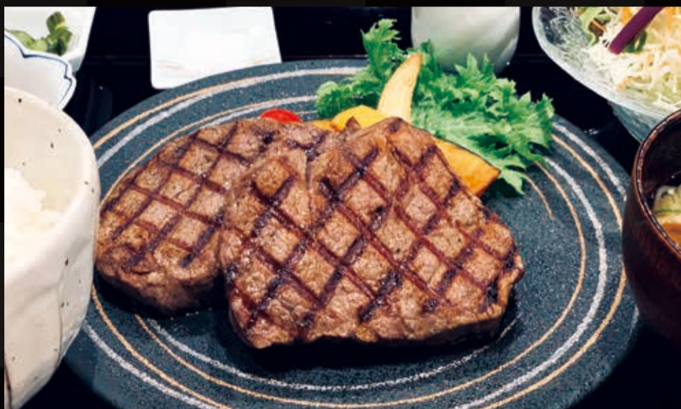
46. 和牛ヒレステーキ定食 200 g