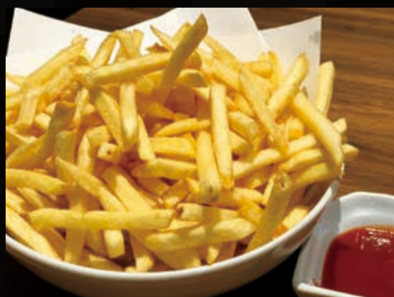
68. 池田山ポテトフライ