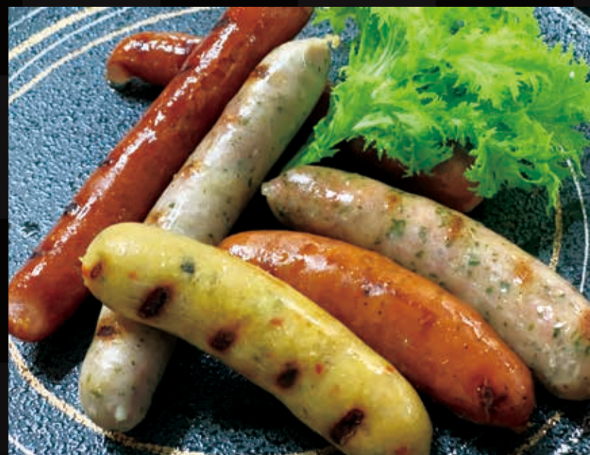
74. 特選ソーセージの3種盛