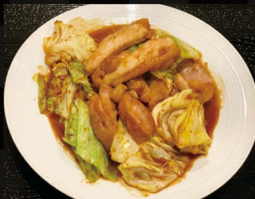
72. けいちゃん (鶏肉味噌炒め) 岐阜名物