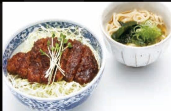
24. 大垣養老高校コラボ味噌カツ丼