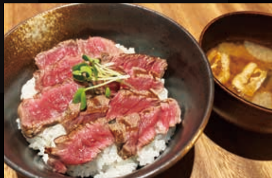
27. 和牛ヒレステーキ丼