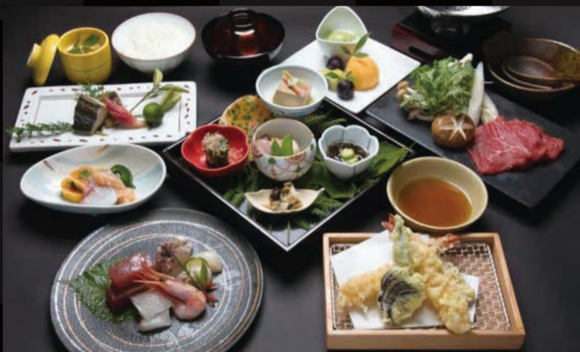
120. 懐石コース 松