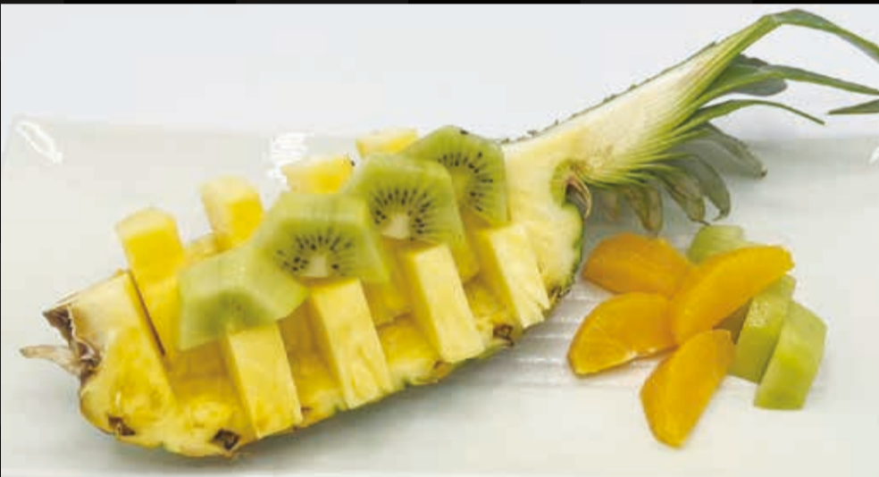
136. 季節フルーツの盛り合わせ (3種)