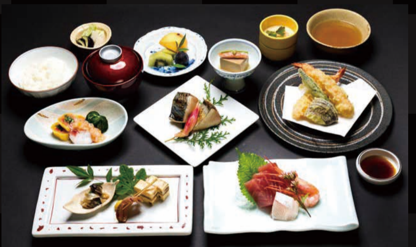
122. 懐石コース 梅