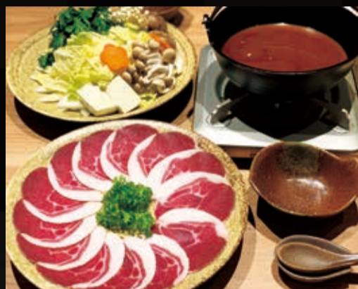
112. 猪鍋 (ぼたん鍋)