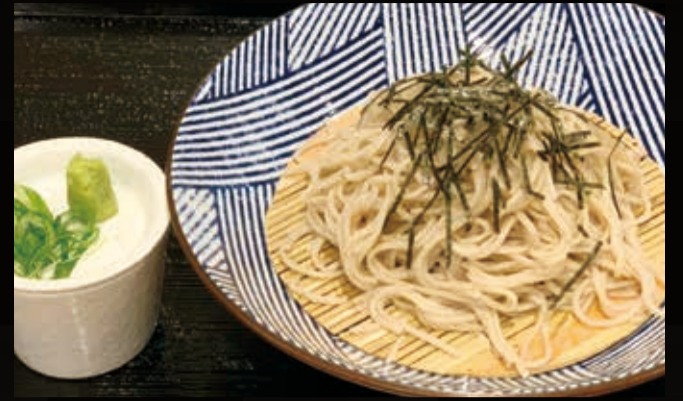
1. 池田温泉そば(ざるそば)