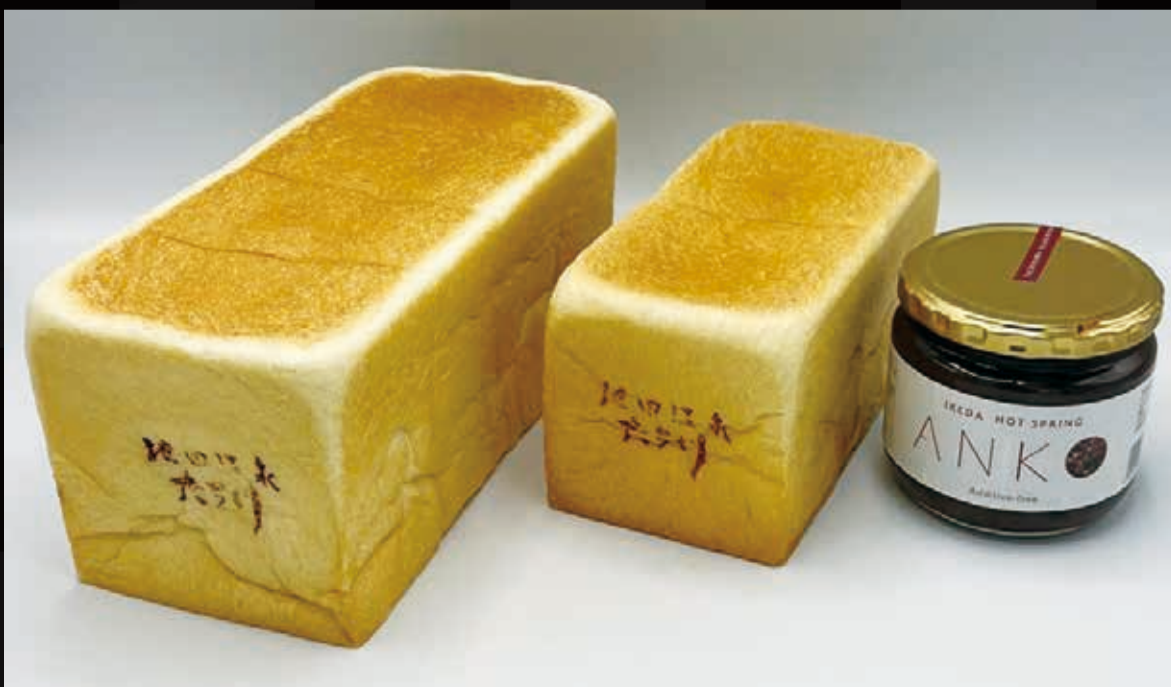
142. 二斤パン & 141. 一斤パン & 143. あんこ