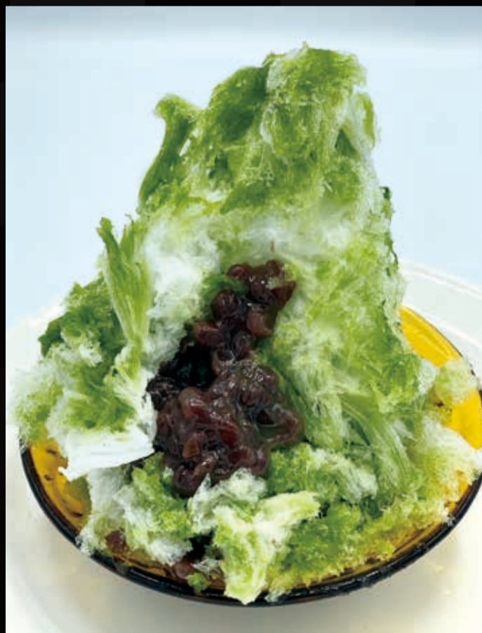
139. 小倉入りいび抹茶