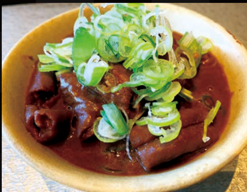
69. 味噌ダレのもつ煮