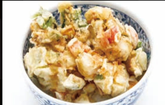
20. 海老と野菜のかき揚げ天井