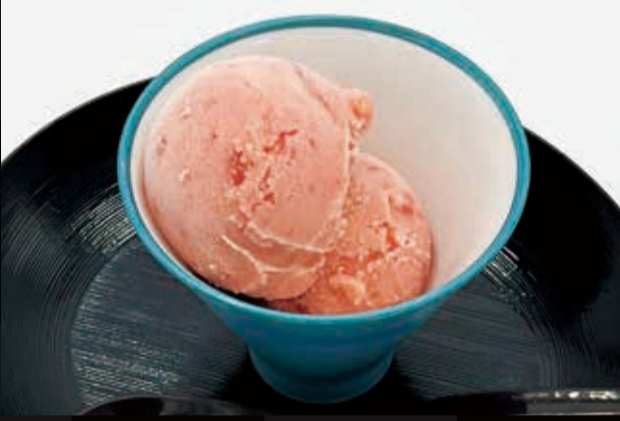
131. 果肉入りシャーベット