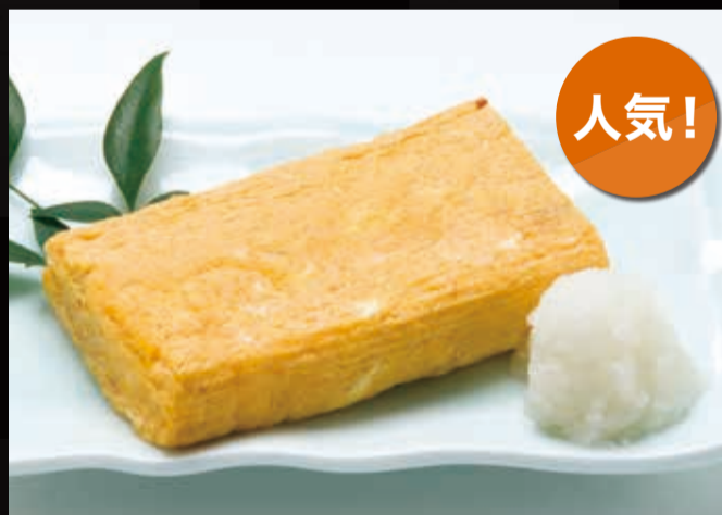
64. 朝獲れたまごの出汁巻玉子