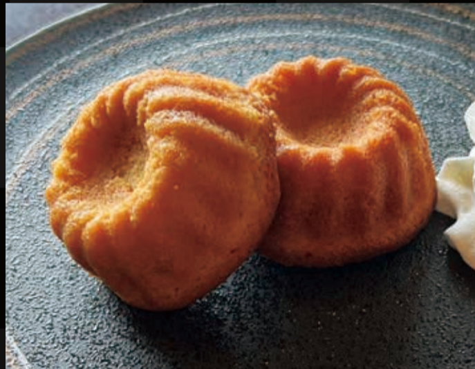
134. しっとりハニークグロフ