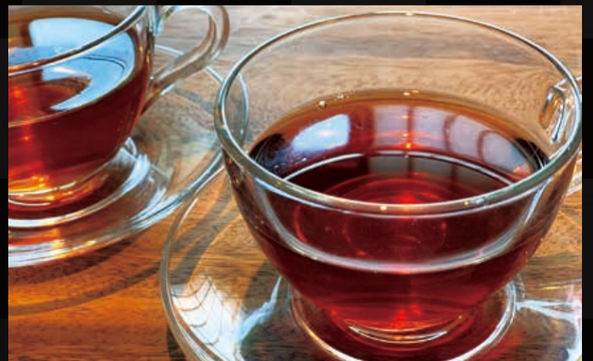
209. さんざしフルーツハーブティー